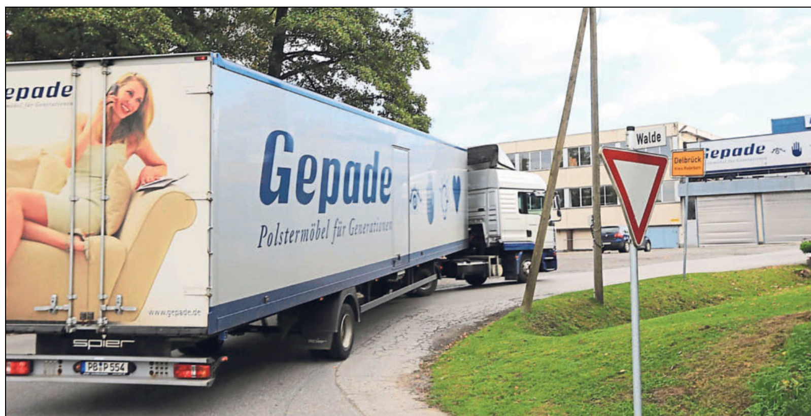
Für Gepade Polstermöbel in Delbrück gibt es offenbar keine Rettung mehr. Insolvenzverwalter Martin Schmidt hat gestern Abend angekündigt, dass die verbliebenen 135 Mitarbeiter Anfang Dezember entlassen werden müssen.

Amsterdam (dpa). Acht Jahre nach der Verstaatlichung ist die niederländische Bank ABN Amro an die Börse zurückgekehrt. Das Geldhaus startete erfolgreich auf dem Parkett in Amsterdam. Der erste Kurs von ABN Amro lag bei 18,18 Euro – ein Plus von 2,42 Prozent gegenüber dem Ausgabepreis von 17,75 Euro je Aktie.