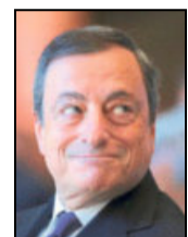
EZB-Präsident Mario Draghi

Seit März pumpt die EZB monatlich 60 Milliarden Euro in den Kauf von Staatsanleihen und anderen Wertpapieren. Das Billionenprogramm soll nach bisheriger Planung bis mindestens September 2016 laufen. Draghi bekräftigte, dieses Programm sei flexibel und könne »in Umfang, Zusammensetzung und Dauer« angepasst werden. Außerdem will der EZB-Rat das Niveau der Strafzinsen für Bankeinlagen bei der EZB neu bewerten. Derzeit zahlen Banken 0,2 Prozent Zinsen, wenn sie Geld über Nacht bei der Notenbank parken. Volkswirte erwarten, dass die EZB den Strafzinsen erhöhen wird.